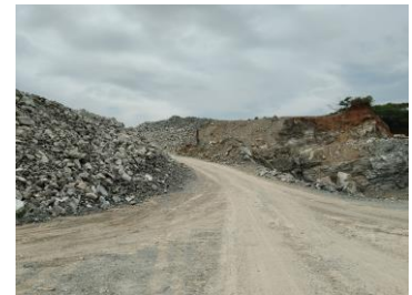
เส้นทางขนส่งแร่ระหว่างหน้าเหมือง-โรงโม่หิน