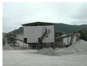
พื้นที่โรงโม่หินของโครงการ