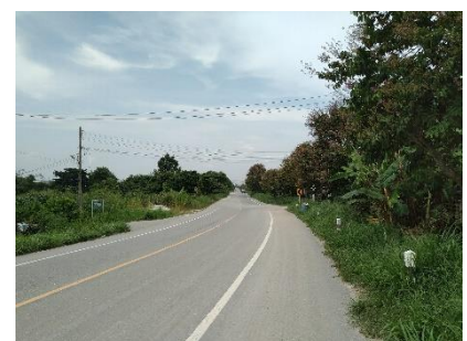
ทางหลวงหมายเลข 3144